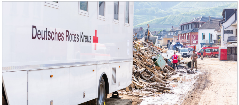
Um in Krisen- und Katastrophensituationen schnell und koordiniert handeln zu können, braucht es geeignetes Material und qualifizierte Einsatzkräfte.

„Qualifizieren und Netzwerken“ – unter diesem Motto entwickelte die Projektgruppe „Rolle der Schwesternschaften im Katastrophenschutz“ im vergangenen Jahr ein Curriculum für die Qualifikation von Pflegeinterventionskräften. Die Projektgruppe setzte sich aus Oberinnen und anderen Mitgliedern aus den Schwesternschaften zusammen. In ihren Diskussionen betonten sie die essenzielle Bedeutung einer verbandsübergreifenden