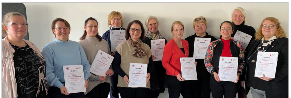
Oberinnen und Rotkreuzschwestern machen sich für die Einbindung der Schwesternschaften im Katastrophenschutz stark und haben erfolgreich an der ersten PIK-Pilotschulung teilgenommen.

Wir halten Sie über die aktuellen Entwicklungen und mögliche Schulungstermine auf dem Laufenden.